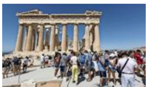
Weil so viele Touristinnen und Touristen die Akropolis besichtigen wollen, gibt es künftig ein Buchungssystem für die Attraktion in Athen.